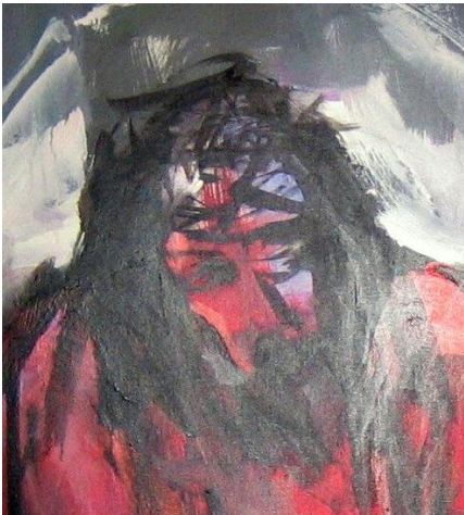
Der Gekreuzigte – Rot

Schauen wir dazu noch einmal auf drei Bilder des Gekreuzigten, wie sie uns Rando vor Augen stellt.