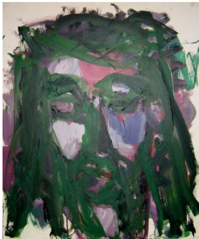
Der Gekreuzigte – Grün